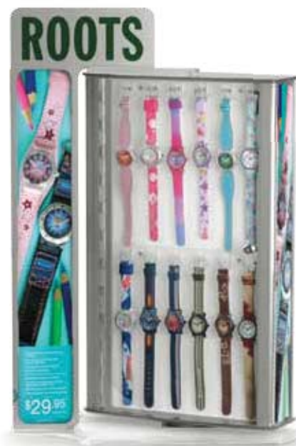
RD-KIDS-04 Roots Kids On-Counter Display Présentoir de Comptoir Roots Kids

15.5"W x 6.5"D x 23"H Largeur 15,5 po x profondeur 6,5 po x hauteur 23,0 po