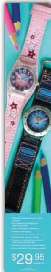
RD-KIDSGR11 Replacement Graphic Panels for Kids On-Counter Display Panneaux graphiques de rechange pour le Présentoir de Comptoir Kids