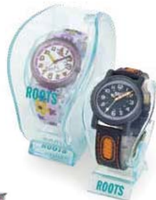
Roots Kids Gift Box Boîte Cadeau Roots Kids

2.0"W x 3.5"D x 3.0"H Largeur 2,0 po x profondeur 3,5 po x hauteur 3,0 po